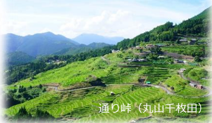
通り峠（丸山千枚田）