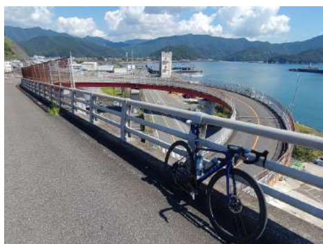
アルファ橋からの眺め[紀北町]