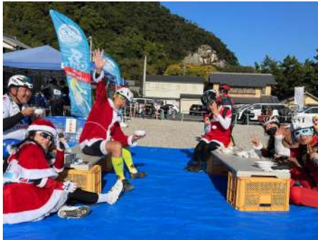
紀南シーサイドヴェロフェスタ