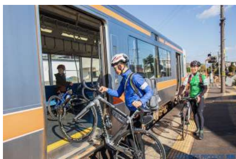
サイクルトレイン実証実験(車外)