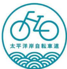
☆太平洋岸自転車道ロゴ