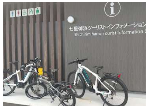
レンタサイクル[御浜町]