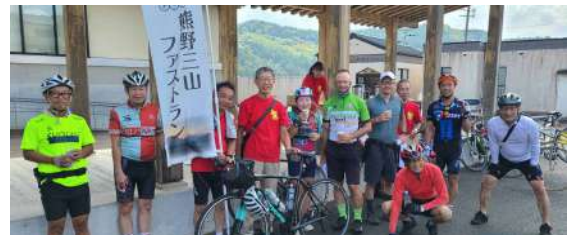
熊野三山ファストラン