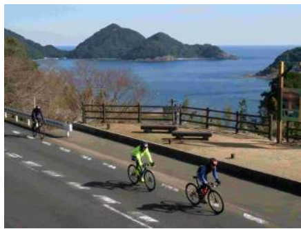
国道 311 号太郎坂広場[熊野市]