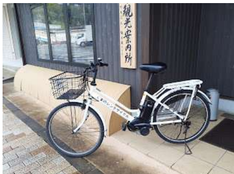
レンタサイクル[熊野市]