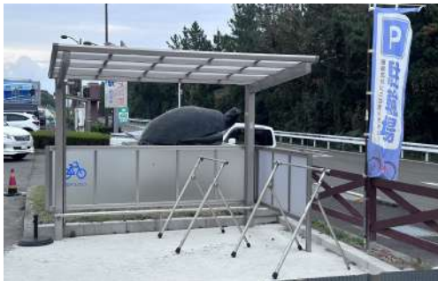
自転車駐輪場[紀宝町道の駅]