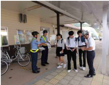
ヘルメット着用街頭啓発[熊野市]