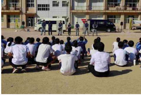
交通安全教室[尾鷲市]