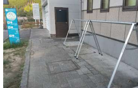
サイクルラック[紀北町道の駅]