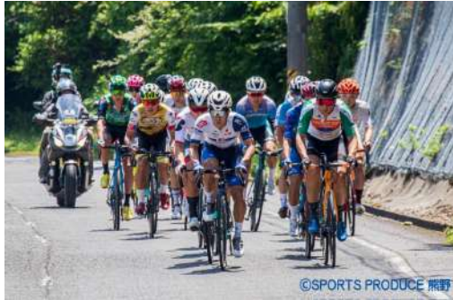
ツール・ド・熊野