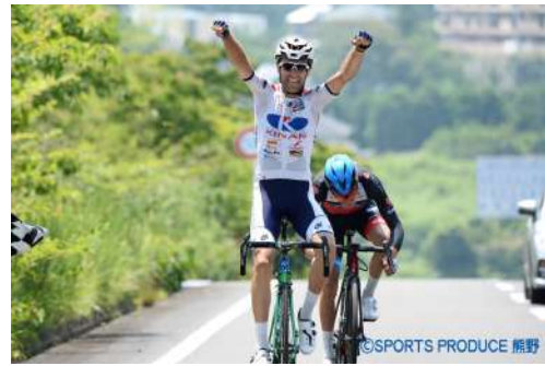
ツール・ド・熊野