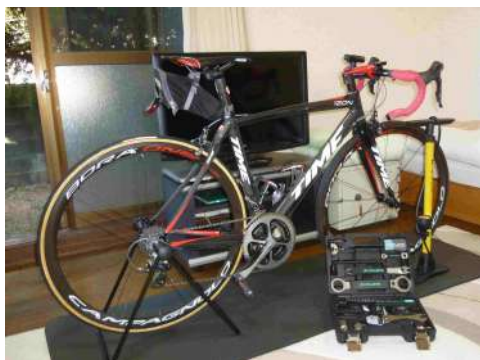
サイクリストにやさしい宿イメージ