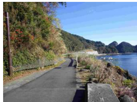
国道 311 号狭隘箇所[熊野市]