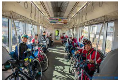
サイクルトレイン実証実験(車内)